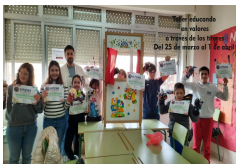
Taller educando en valores a través de los títeres Del 25 de marzo al 1 de abril