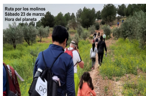
Ruta por los molinos Sábado 23 de marzo Hora del planeta