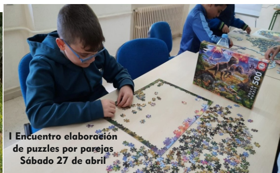
I Encuentro elaboración de puzzles por parejas Sábado 27 de abril