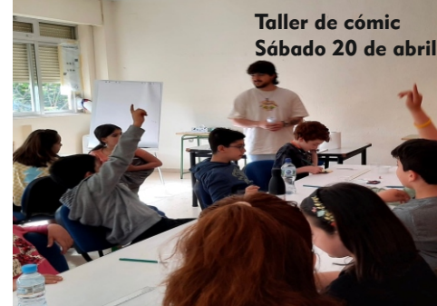
Taller de cómic Sábado 20 de abril