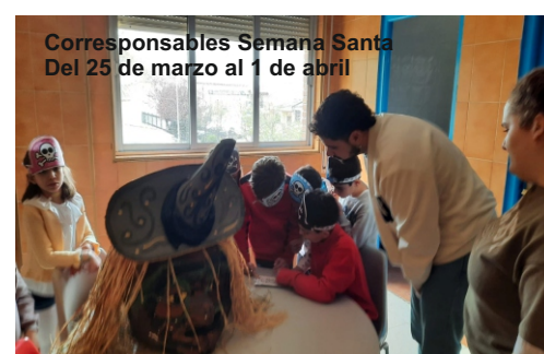
Corresponsables Semana Santa Del 25 de marzo al 1 de abril