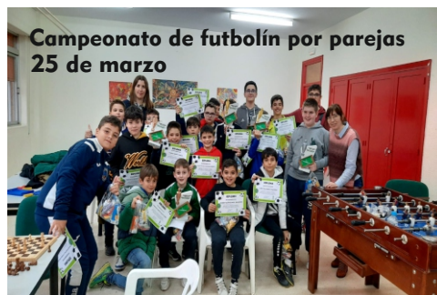
Campeonato de fútbolín por parejas 25 de marzo