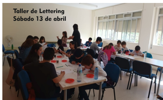
Taller de Lettering Sábado 13 de abril