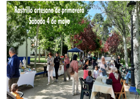
Rastrillo artesano de primavera Sábado 4 de mayo