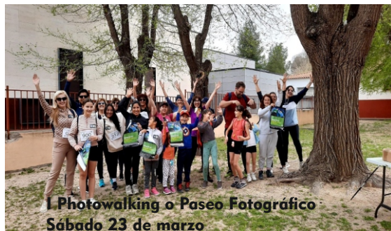
I Photowalking o Paseo Fotográfico Sábado 23 de marzo